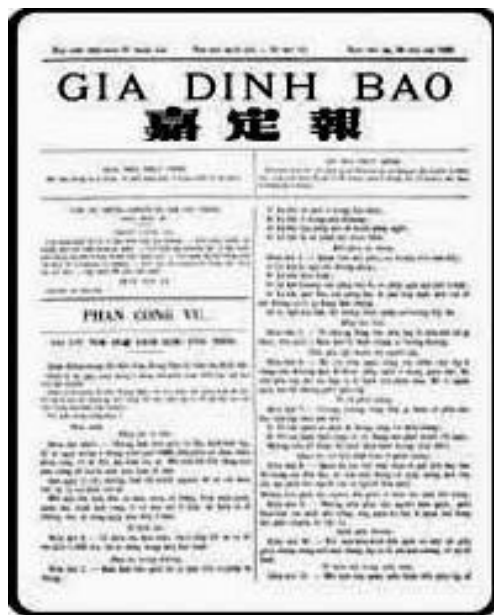
Gia Định Báo (1865-1897)

Song song với việc mở trường dạy học, người Pháp còn cho ra tờ Gia Định Báo (1865 - 1897) là tờ báo in chữ Quốc ngữ đầu tiên ở Việt Nam được ra mắt vào năm 1865 tại Sài Gòn. Lúc ban đầu tờ báo này chỉ là một công cụ thông tin của Pháp, từ năm 1869 được giao cho Trương Vĩnh Ký làm Giám đốc và Huỳnh Tịnh Của làm Chủ bút. Từ đó tờ Gia Định Báo mới thật sự khởi sắc, vì đã được phát triển thêm các mục biên khảo, lịch sử, thơ văn, nghệ thuật.... Tờ báo này đã góp phần không nhỏ vào việc cổ động học chữ Quốc ngữ, khuyến khích theo tân học, mở đường cho sự sáng tác các thể loại thơ văn bằng chữ Quốc ngữ và tạo nền móng cho sự nở rộ của báo chí Việt Nam sau này.