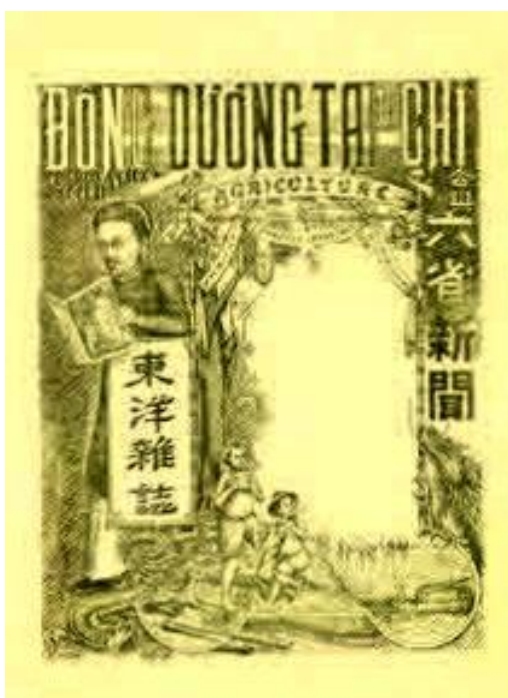
Đông dương Tạp chí (1913-1919)

Đến cuối thế kỷ 19 thì chữ Quốc ngữ đã không còn loanh quanh trong khu vực các nhà thờ của các giáo sĩ người Pháp nữa mà đã đi vào trường học và báo chí. Nhờ sự nở rộ của báo chí, trong đó có sự đóng góp không nhỏ của Gia Định Báo, đã tạo điều kiện cho sự xuất hiện nhiều nhà văn tài năng, nhiều tác phẩm giá trị. Đặc biệt là sự ra đời của cuốn từ điển Đại Nam quốc âm tự vị do Huỳnh Tịnh Của soạn năm 1895. Đây là cuốn từ điển đầu tiên do người Việt soạn cho người Việt, đến nay vẫn còn hữu dụng.