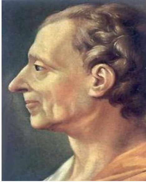
Charles de Secondat Montesquieu (1689-1755)